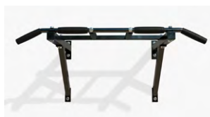
Attrezzi per fitness