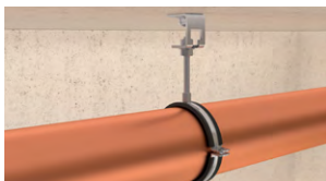
Pendinature per tubazioni